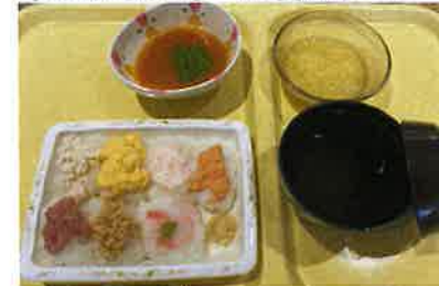
てまり寿司(粥ゼリー)

お粥、柔らかいお食事の方には粥ゼリーで、てまり寿司で提供し、 ミキサー食の方はネタごとに分けて盛り付けました。