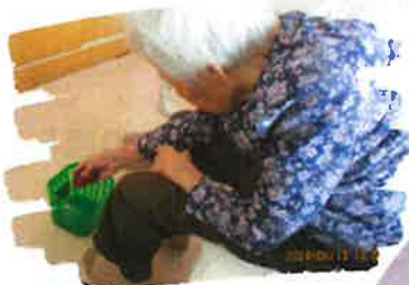
お手玉を前へ… 支えなしで座る練習

作業療法では、基本的な運動能力、応用的な動作能力、社会に適應する能力の維持や改善を目指します。