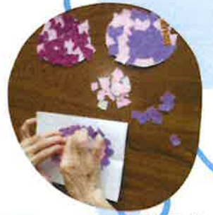
季節の作品：紫陽花製作中