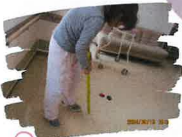
ゴルフを楽しみ… 立ったままの動作で 転ばないように練習