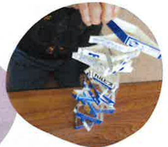
高く積み上げて 手の練習