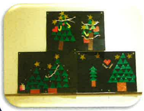
クリスマスツリー